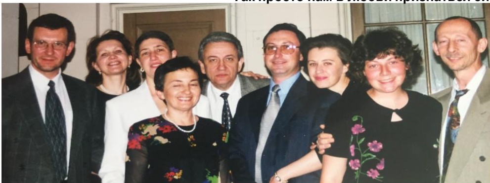
Так просто нам в любви признаться ей!