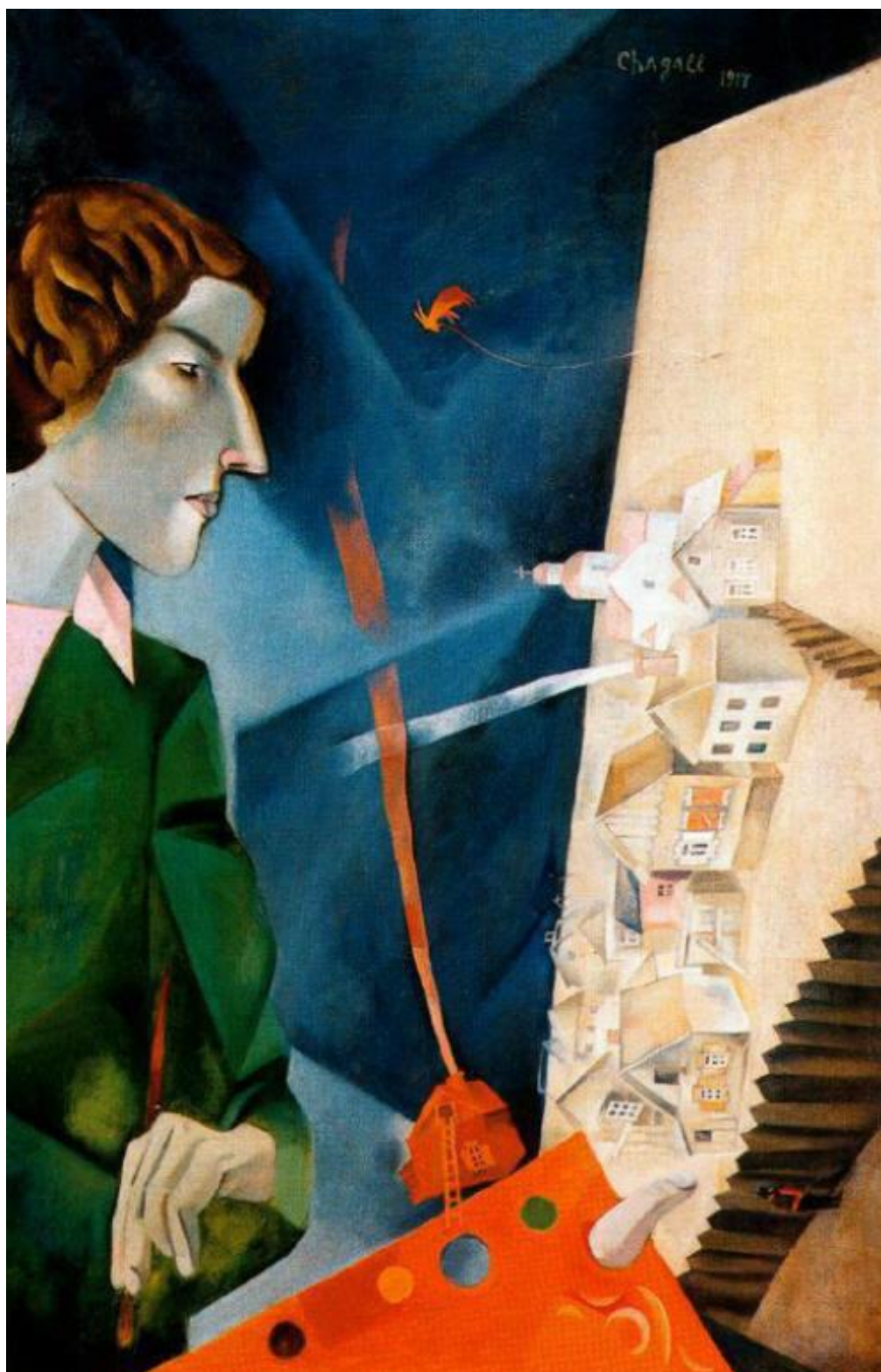
И пишет, в небесах паря, Отлёт евреев в Палестину